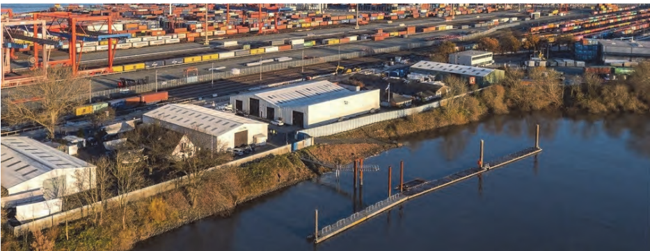
Unsere Steganlage an einem ruhigen Wintertag im Dezember