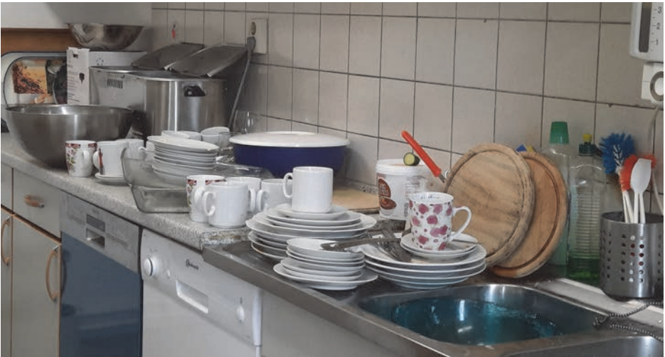
Auch die Küche ist etwas überlastet...