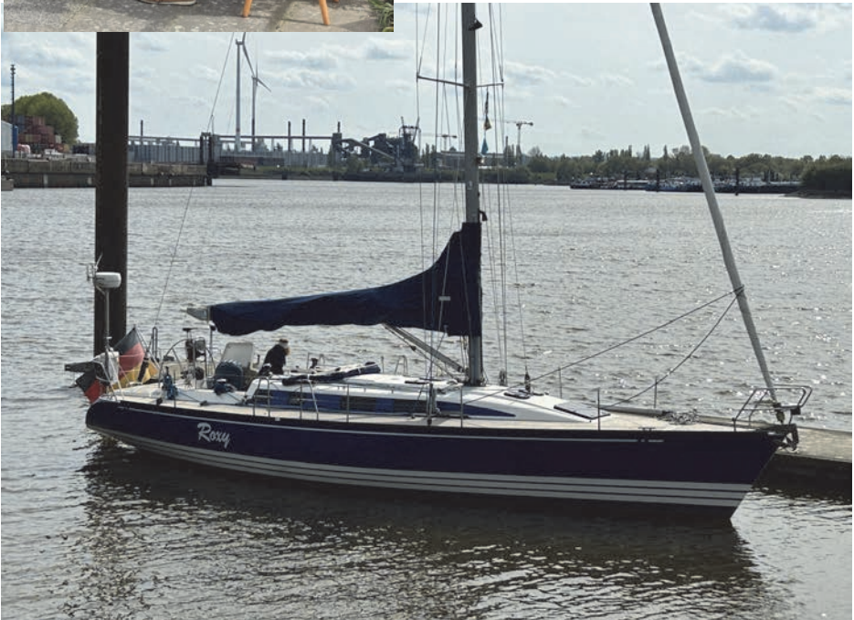
Nur „Roxy“ kam übers Wasser