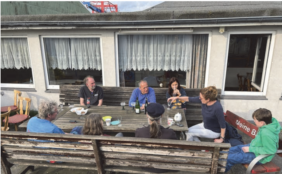
„Manöverkritik“ mit Prosecco ...